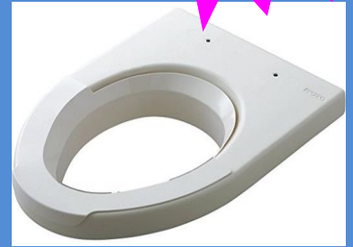
かさ上げ高さは 3cmと5cmの2サイズ